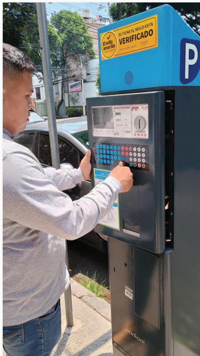
Parquímetros Tempo de Parkare, asistidos por nuestra empresa.

En las ciudades ordenadas con programas de parquímetros se aprecian calles y avenidas con un flujo de movilidad adecuado, menos ruido, disminución del tiempo de los viajes, mas organización, mejoría en el paisaje urbano y soluciones a problemas de interés de la población de barrios y colonias.