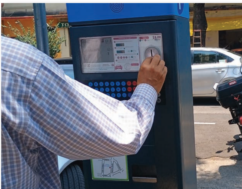
Usuario pagando el servicio

Los parquímetros inteligentes pueden ser útiles para la información gubernamental o de publicidad, desde sus pantallas de alta resolución o vista como negocio.